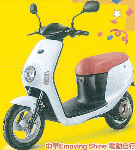
中華Emoving Shine 電動自行車